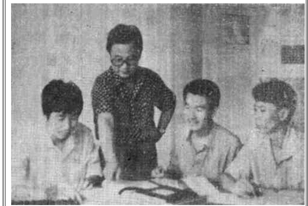
图为市审计局审计组的同志们在认真进行审计。