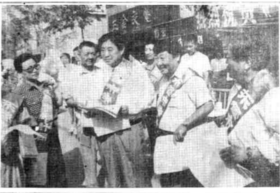
我市各级审计部门认真做好《审计法》的宣传工作，图为△副市长滕化迎向市审计局的领导向群众发放宣传材料。

审计师事务所发展的前景是美好的，但当前面临的形势也是严峻的。首先，要进一步解放思想，放开手脚，让事务所大胆地闯、大胆地试，积极开拓、扩大规模，增强事务所的竞争力，把事务所推向市场，以质量求生存，以信誉求发展。其次，要帮助事务所搞好协调，创造一个平等竞争的社会环境。其三，帮助拓展业务，占领市场。除继续巩固老业务外，要不断的开拓新的业务，如股份制企业、三资、外资、合作企业审计等等。要提高人员素质，保证审计质量，强化攻关，改善服务，在市场竞争中独领风骚。其四，要加强领导，改善管理。尤其是对审计事务所的业务质量、职业道德、廉政建设要加强监督检查，实行规范化管理，更好地为市场经济发展服务。