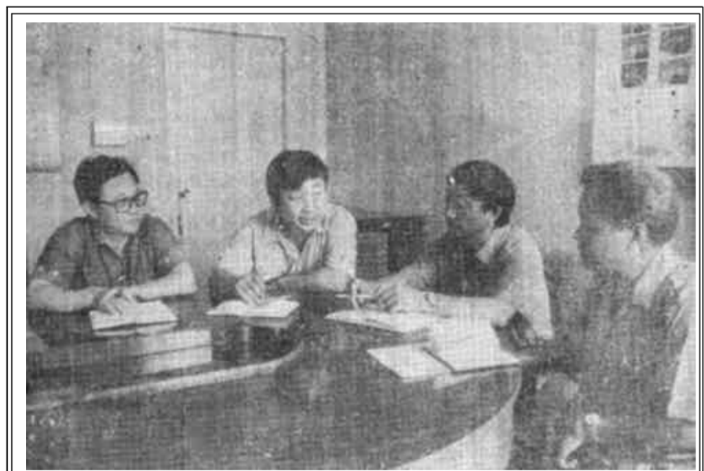
图为市审计局的领导们在一起研究工作。

等扰乱市场秩序的行为，保证国民经济的健康发展。同时，通过对财务收支及经济活动的审计，对维护财政经济法规、法纪，促进廉政建设有着积极的作用。